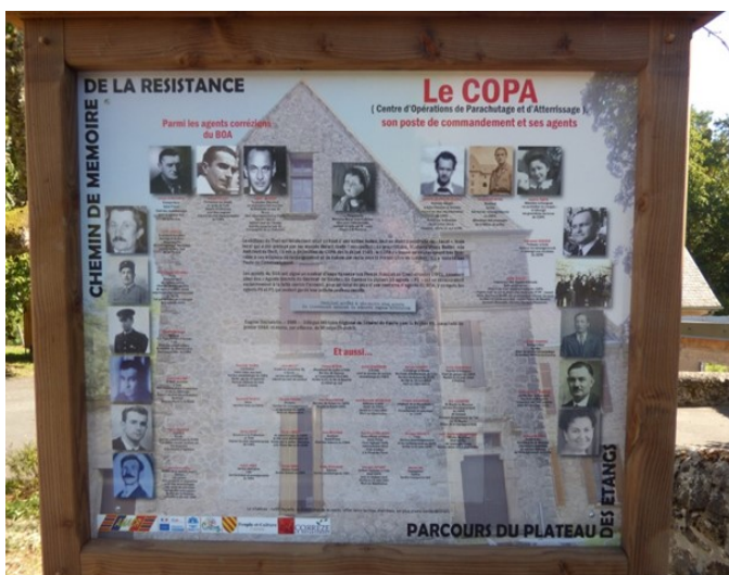
Panneau dédié au réseau COPA corrèzien à Saint-Pardoux-la-Croisille

Chaque région française était pourvu d'un centre d'opérations de parachutage et d'atterrissage, nommé « COPA » (connu sous le nom de SAP, après juin 1943), qui dépendait du « BOA » (Bureau des Opérations Aériennes), un bureau spécifique destiné à favoriser les échanges avec le territoire français, placé au sein du « BCRA » (Bureau central de renseignements et d'action) créé par le Général De Gaulle en 1942.